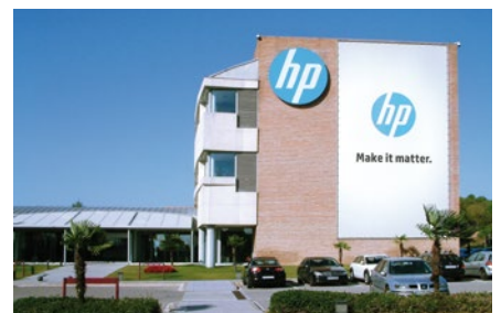
HP Demo- und Trainingscenter bei Barcelona