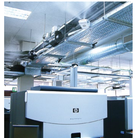
Optimale Luftfeuchte schützt vor Elektrostatik im Digitaldruck

Condair Systems GmbH Nordportbogen 5 22848 Norderstedt Telefon: +49 40 853277-0 Telefax: +49 40 853277-44 E-Mail: info@condair-systems.de Internet: www.condair-systems.de