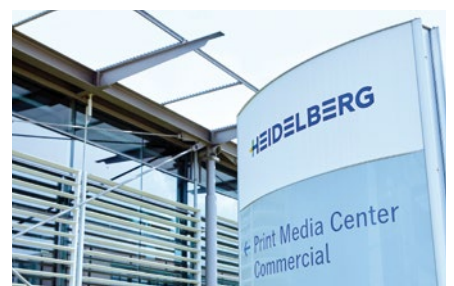
Print Media Center Commercial in Wiesloch-Walldorf

Wie wichtig die optimale Luftfeuchte für die Performance und den störungsfreien Druckprozess ist, beweist seit 2015 erneut die DRAABE Luftbefeuchtung.