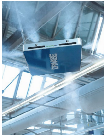
DRAABE TurboFogNeo 8: wirtschaftlich und hygienisch