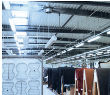
Eine geregelte Luftfeuchte ist Teil des Qualitätsmanagements bei Fritz Hansen