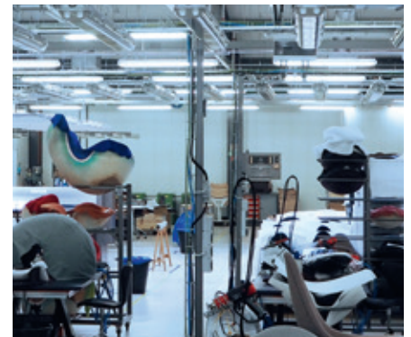
Eine relative Luftfeuchte von 40% sichert die hochwertige Verarbeitung der Design-Stühle

Condair Systems GmbH Nordportbogen 5 22848 Norderstedt Telefon: +49 40 853277-0 Telefax: +49 40 853277-44 E-Mail: info@condair-systems.de Internet: www.condair-systems.de