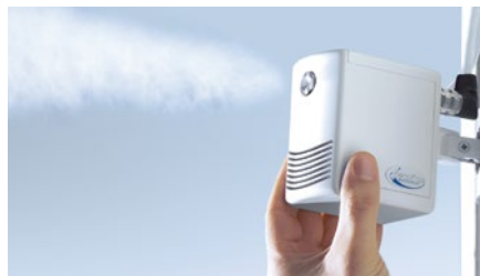
Der mikrofeine Aerosol-Nebel wird sofort von der Raumluft aufgenommen