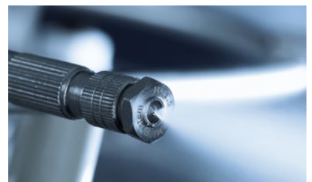
Hochdruckdüsen-Luftbefeuchtung kühlt und schützt vor Elektrostatik

Hohe Temperaturen und zu trockene Luft gefährden die Lebensdauer von Servern und Speichersystemen. Zur Kühlung und zum Schutz vor Elektrostatik können Hochdruck-Luftbefeuchter die Energieeffizienz im Rechenzentrum deutlich steigern. Neue energieeffiziente Möglichkeiten der Klimatisierung bietet der Einsatz von Hochdruck-Luftbefeuchtern: Mit einem Druck von bis zu 85 bar zerstäuben Hochleistungsdüsen kaltes Wasser in mikrofeine Aerosole, die sofort vollständig von der Raumluft aufgenommen werden. Die so entstehende Verdunstungskühle senkt die Raumtemperatur. Gleichzeitig wird eine optimale relative Luftfeuchtigkeit gesichert.