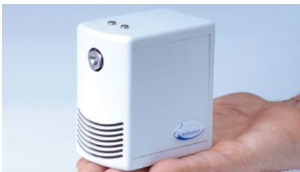
DRAABE NanoFog Evolution passt in jeden Serverraum