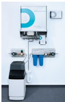
DRAABE DuoPur Compact

Mit wenigen Handgriffen ist der benutzte DRAABE Pur Container gegen ein rundum gewartetes System ausgetauscht. Hygiene und Sicherheit sind so immer garantiert – ohne zusätzliche Kosten, Zeit und Aufwand.