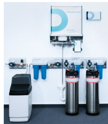
DRAABE TrePur Compact