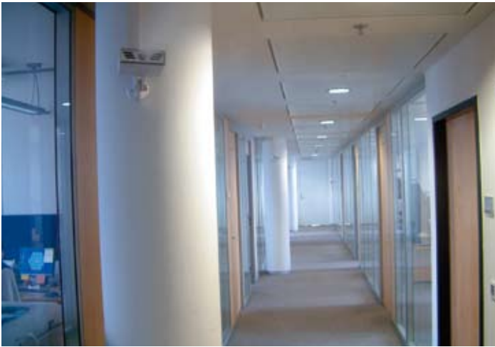
Die Direkt-Raumluftbefeuchter konnten problemlos im Neubau nachgerüstet werden