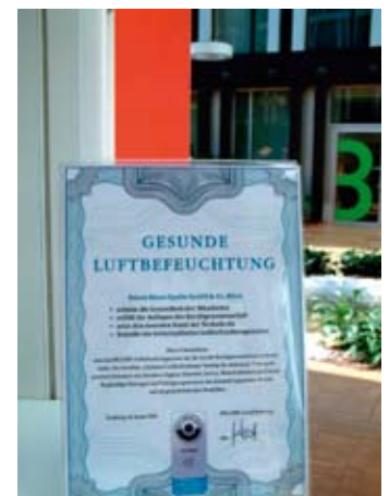
Dokumentierte Sicherheit: Das Zertifikat „Optimierte Luftbefeuchtung“ im Foyer bei Bristol-Myers Squibb

Squibb am Standort München einen energieeffizienten Beitrag zum Wohlbefinden und Gesundheitsschutz seiner Mitarbeiter umgesetzt.