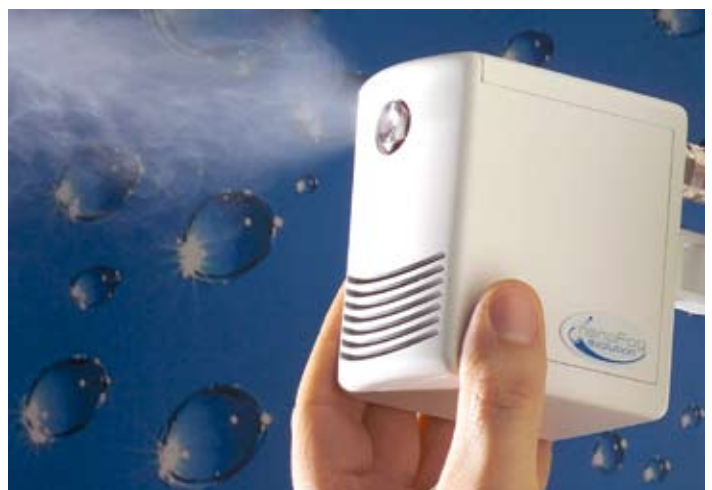
Direkt-Raumluftbefeuchter sind horizontal und vertikal schwenkbar

Das Unternehmen zählt zu den führenden Pharmaunternehmen. Das Unternehmen entwickelt Arzneimittel, unter anderem für die Behandlung von Krebs, Herzkrankungen, Diabetes und Rheuma. Die deutsche Hauptverwaltung hat 2008 einen Neubau in der Münchener Innenstadt bezogen, um dem wachsenden Flächenbedarf gerecht zu werden. Das Konzept der Nachhaltigkeit ist Bestandteil der Unternehmenskultur bei Bristol-Myers Squibb und so auch konsequent bei der Planung und Realisierung des Neubaus berücksichtigt.