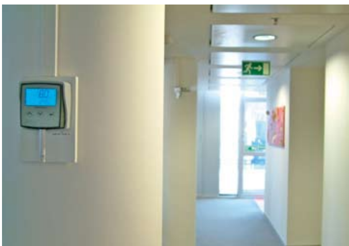
Die gewünschte Luftfeuchtigkeit wird über Digital-Hygrometer geregelt