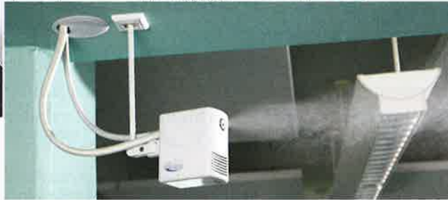
Draabe NanoFog Direkt-Raumluftbefeuchtung